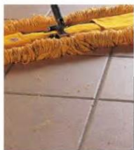
従来の施釉床タイル

表面の凹凸を改良することにより、清掃時におけるモップが引っかかりにくくなり、清掃性が向上します。