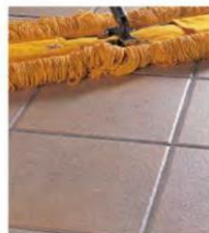
マイクロガードフロア