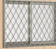
面格子付き引違い窓 (面格子：タテ・ヒシクロス)