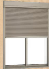
シャッター付引違い窓